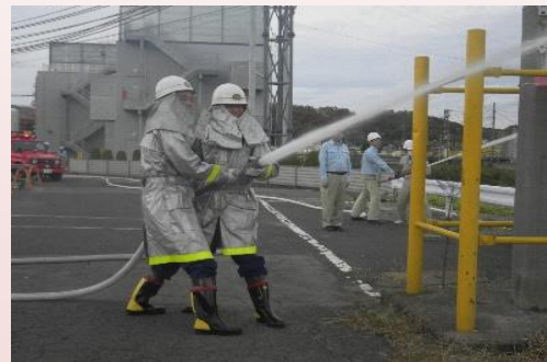
平成27年度火災防ぎょ訓練 訓練場所：日東紡績福島工場