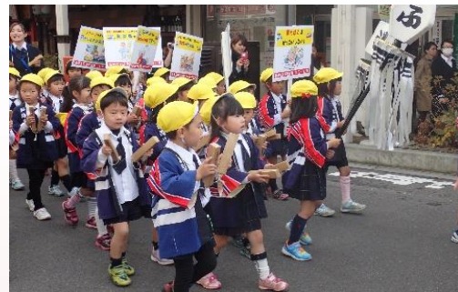
平成27年度防火パレード