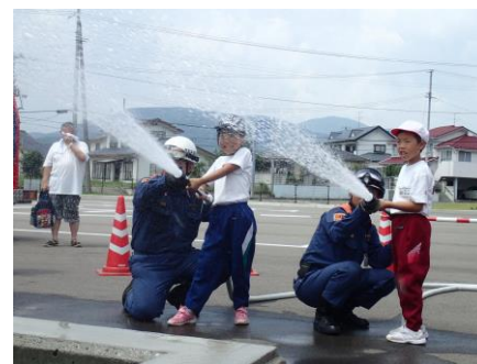
昨年の体験教室の様子