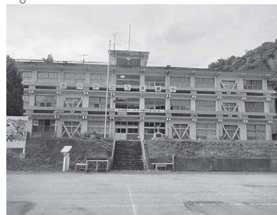
今年3月閉校の旧大波小学校

答 廃校施設の利活用については、「公共施設等総合管理計画」の基本方針に基づき、学校施設としての特性を生かし、芸術・文化、生涯学習等の教育施設、その他行政需要での活用のほか、民間事業者による利活用など、地元や関係部局と調整を図りながら、幅広い利活用について検討していく。