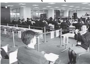
本会議における手話通訳