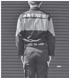
消防団の新活動服

また、一般会計予算(消防団新活動服整備事業)については、これまで夏活動服1着と冬活動服1着を貸与していたものを、国の服制基準変更に伴い、新基準となるオールシーズン活動服1着を平成28年度より新入団員並びに経年劣化による更新者から順次貸与を行っており、平成30年度において、未更新の全団員に対し、新活動服を貸与することで服装の統一化を図るものである旨の説明がありました。