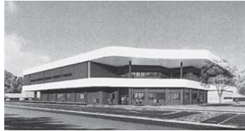
福島市体育館・武道場 (完成予想図)

うち、福島市体育館・武道場条例制定の件については、現在、霞町に建設中の体育館及び武道場を平成30年10月から供用を開始するにあたり、施設概要や開館時間、使用の許可及び使用料等を定めた条例を制定する旨の説明がありました。