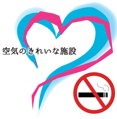
空気のきれいな施設