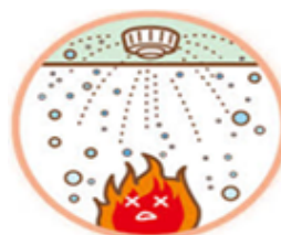
スプリンクラー設備