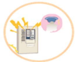
自動火災報知設備