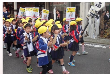
昨年の防火パレードの様子