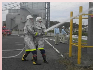
平成27年度火災防ぎょ訓練の様子