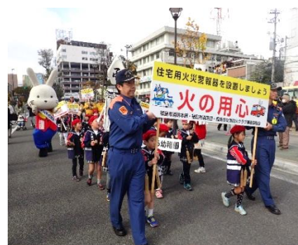
昨年の防火パレードの様子