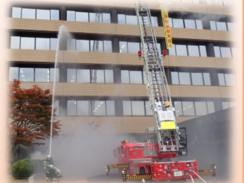
昨年の火災防ぎょ訓練の様子