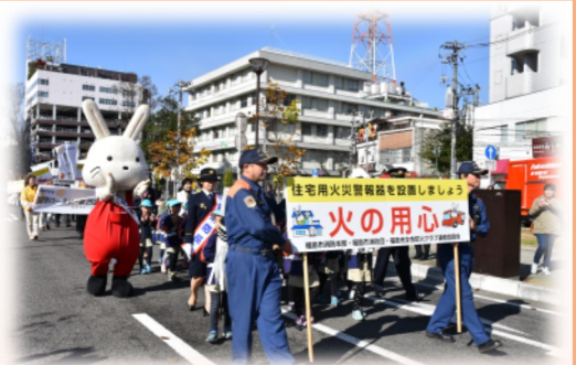
昨年の防火パレードの様子