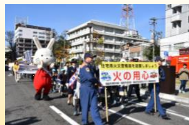
防火パレードの様子