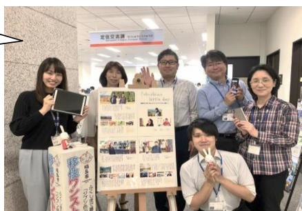
定住交流課のスタッフ