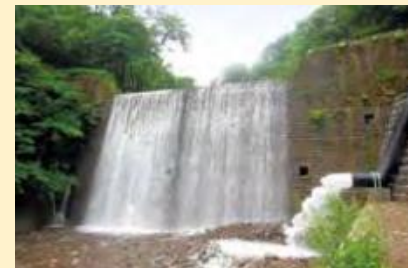
▲土湯温泉町東鴉川小水力発電所