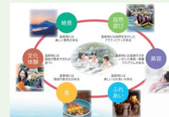
▲元気になる温泉地での様々な過ごし方