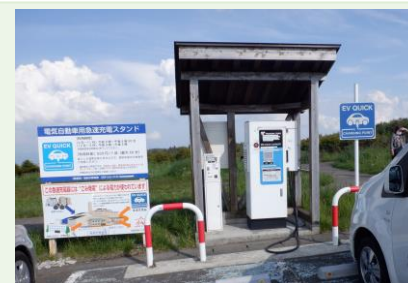
▲再エネ電力による充電器(道の駅つちゆ)