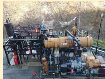
▲温泉熱を利用したバイナリー発電施設