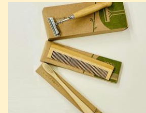
▲竹製品のアメニティ導入