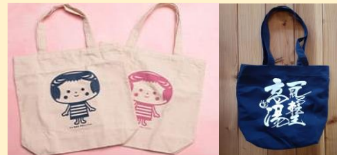
▲オリジナルマイバックの作成