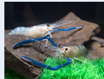
▲「つちゆ湯愛ゆめエビ」の釣り