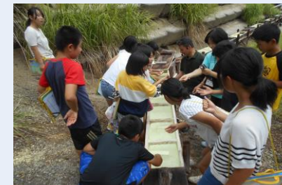
▲高湯温泉の源泉見学会