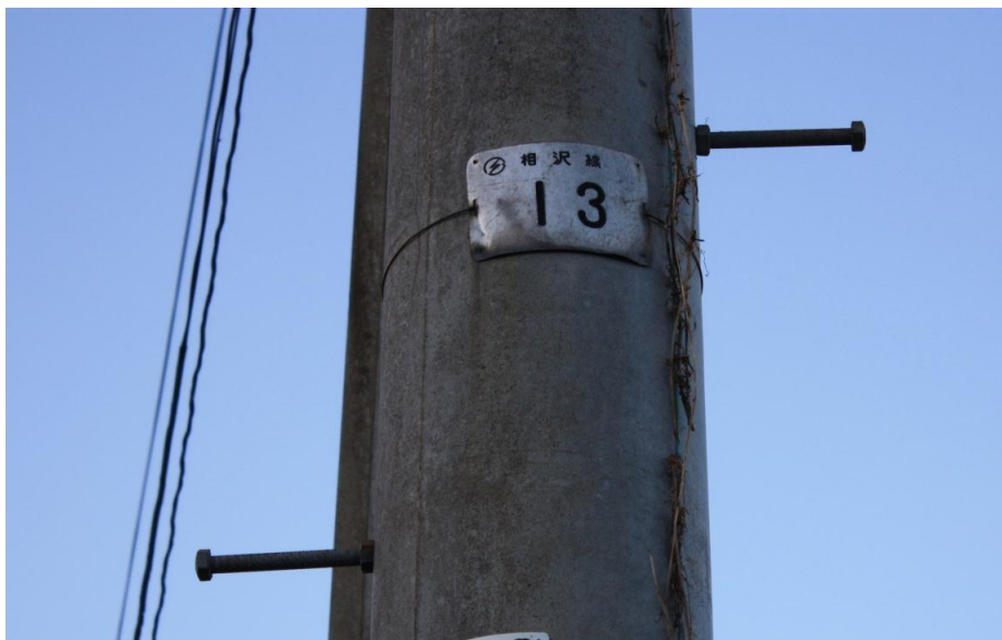
【写真一4】 接続電柱(相沢線12)