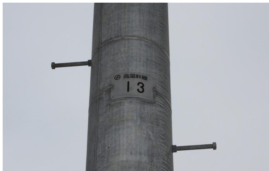
【写真一5】 接続電柱(高湯幹線13)