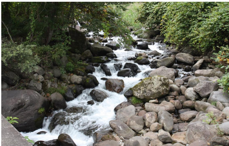
【写真-1】 市道・潜り橋から上流を撮る