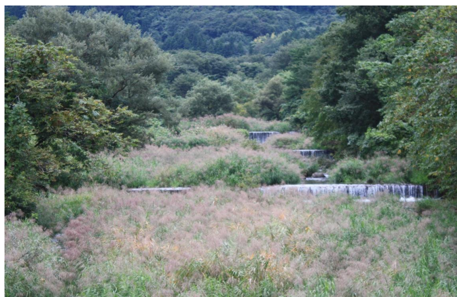
【写真-3】 市道・小坂橋から上流を撮る (発電所想定地点)