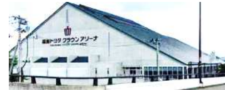
仁井田(福島西道路沿い)