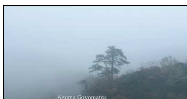
<BONSAI AZUMA GOYOMATSU>