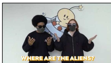
<Alien Hunting in Fukushima City, Japan>