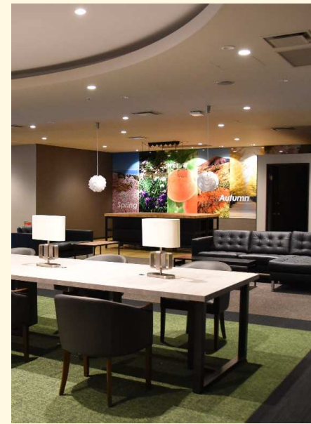
クリエイティブ ビジネスサロン