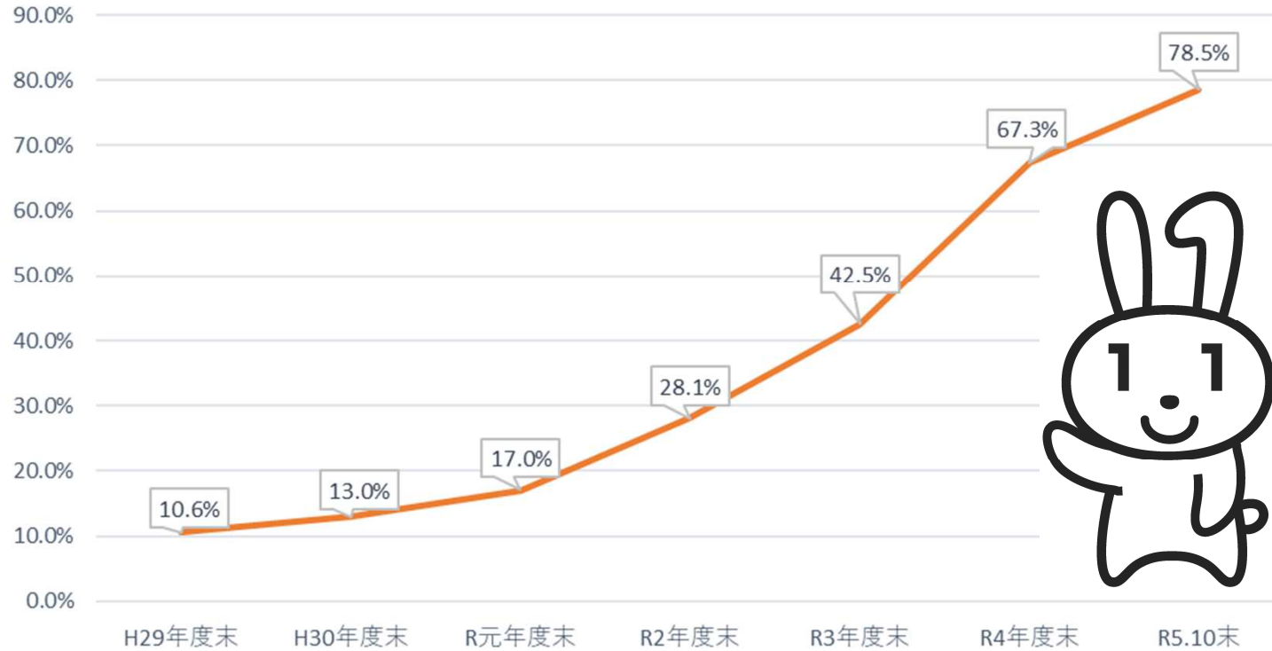
マイナンバーカード交付率