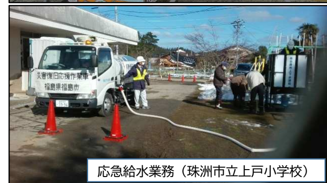
応急給水業務（珠洲市立上戸小学校）