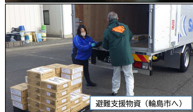
避難支援物資（輪島市へ）