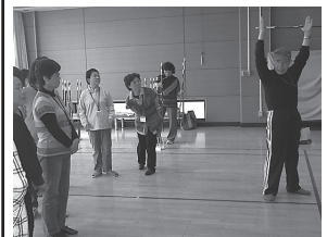
「スポーツ吹矢」教室