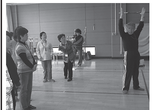
「スポーツ吹矢」教室