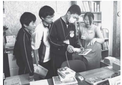
図書室業務体験の様子

学習センター・支所の業務や施設の清掃活動、図書室の業務などに熱心に取り組んだほか、学習センター利用団体のサークル活動に体験参加しました。