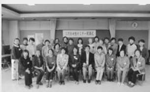
開講式 (三河台学習センター)