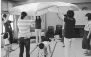
リトミック (三河台学習センター)

学習センターでは、年間を通して様々な学習をしていただくために、今年度も下記のとおり各種学級を開設します。ぜひ、ご参加いただいて、新しい出会いや体験をする機会にされてはいかがでしょうか？