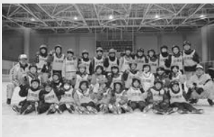
スケート体験教室 (磐梯熱海アイスアリーナ)