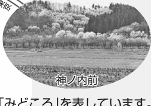
のマークは「みどころ」を表しています。