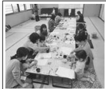
すくすくセミナー