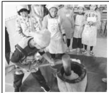
少年わくわくクラブ