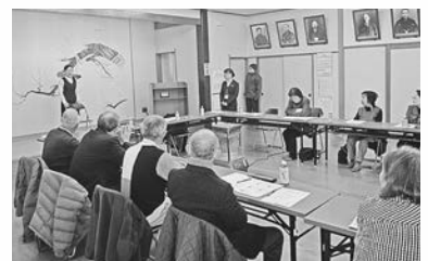
講師は信陵地域包括支援センターの方々

「認知症サポーター養成講座」の内容で研修が行われ、参加者は認知症への理解を深めました。今後地域で認知症の人や家族を見守る応援者としての役割が期待されます。