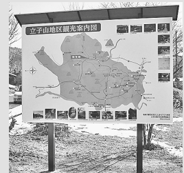
国道114号線沿いに設置した観光案内板