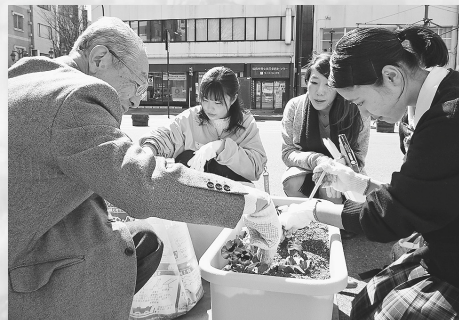
▲子どもたちや学生も地域住民と一緒に一生懸命パンジーを植えました