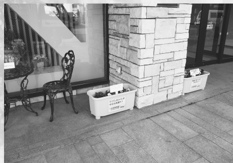
▲事業所などに設置したプランター