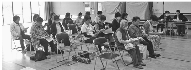
開講式&ルーシーダットン(タイ式ヨガ)体験教室