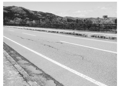
舗装工事が行われる あづま公園橋