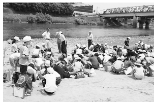
渡利小5年生の様子

5年生は6月5日(火)に水質調査を、3年生は7月6日(金)に笹舟作りをそれぞれ体験しました。子供たちは質問をしたり、メモを取ったりと真剣に取り組んでいました。