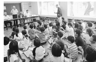
渡利小3年生の様子