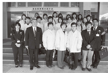
県警本部前で記念撮影