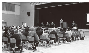
講演会笑う門には福来たる