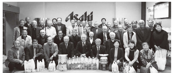
アサヒビール福島工場見学