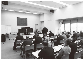
二本松市役所にて