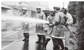
21分団による中継送水訓練

11月9日から15日まで全国一斉に秋季火災予防運動が実施されました。その初日、福島キヤノン株式会社福島工場において、近隣事業所の日東紡績株式会社福島第二工場との連携訓練及び消防機関と陸上自衛隊福島駐屯地との放水訓練など総合防災訓練を実施しました。