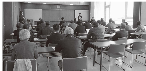
岩沼市の担当者から協働のまちづくりについて説明を受ける参加者

11月19日(月)、荒井・佐倉地区自治振興協議会及び町会連合会合同で岩沼市を視察してきました。岩沼市は元々市民活動が盛んな地であり、人口約44,300人ながら市民活動団体は300程あるそうです。震災では津波による甚大な被害を受けた市です。震災の約1年前から「協働のまちづくり指針」について、市民と行政が検討を重ね、震災の約3か月後には指針を策定しました。これらの話し合いは、震災復興にも大いに役立ったとのこと。行政の力だけでは困難な課題解決のため、様々な主体が信頼関係を築き協力し合うことの大切さを学ぶことができました。