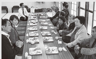
佐倉婦人会による昼食会で楽しく歓談される皆さん

11月16日に佐倉婦人会による「昼食会」が西学習センターに於いて実施され、11月21日には荒井地区婦人会による「配食サービス」が実施されました。両婦人会とも、地区内のひとり暮らしの高齢者の方などを対象に、地元の新米や旬の野菜を使った手作りの料理を提供し、「昼食会」の参加者や「配食サービスのお弁当」を受け取った方々が笑顔の一日となりました。