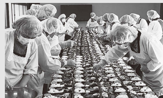
弁当を手際よく準備する荒井地区婦人会の皆さん