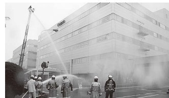
30m級先端屈折式はしご車による放水訓練