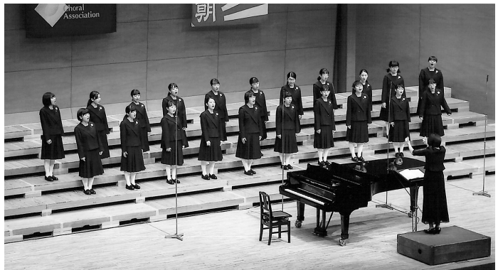
金賞に輝いた全国大会の舞台

A④ みなさんの暖かい応援のおかげで、全国大会のステージで練習してきたことを出し切ることができました。本当にありがとうございます。これからも、私たちの活動を見守っていただけると嬉しいです。よろしくお願いします。