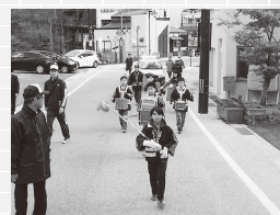
秋の火災予防パレードの様子