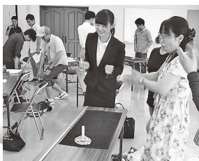
若者のための心理学講座