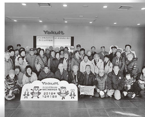
あつかし歴史館見学