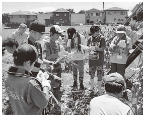
トウモロコシ収穫