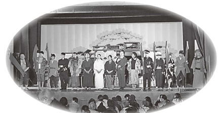
旧広瀬座で行われた地域の歴史をテーマとした演劇