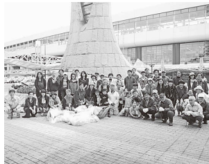
JR福島駅西口駅前広場にて

今回も、地域の方を中心に約70名のみなさんが、三河台学習センターから福島駅西口まで、歩道のごみ拾いを1時間ほど行いました。