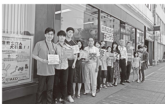
◀オープニングセレモニーに参加した市長と運営協議会の皆さん

休憩スペース、情報発信スペースとしての利用のほか、交流・活動拠点としての利用も出来ます。