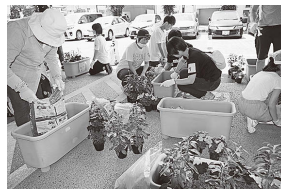
▲福島市役所正面駐車場で子どもたちや学生も地域住民と一緒に花苗を植えました。

5月26日に開催した第6回「花によるおもてなし事業」は、中央東地区まちづくり計画推進懇談会が、絆まつりで街なかを訪れる皆さんをおもてなしの心でお迎えしたいという思いから、まちづくりの取り組みとして行なったものです。一般ボランティア、子どもたちや高校生、大学生、地域住民の皆さん約80人が協力して花苗を植えたプランターには、「おもてなし」メッセージも添えてあります。