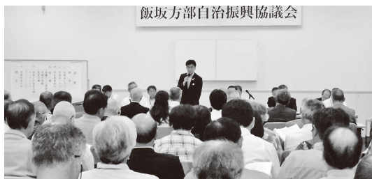
飯坂方部自治振興協議会