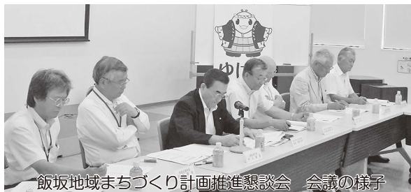
飯坂地域まちづくり計画推進懇談会 会議の様子

飯坂の活性化につなげようと同懇談会のワーキンググループが中心に企画しましたが、今後は飯坂の各種PRなどで「ゆげお」が活躍していく予定です。どうぞよろしくお願いいたします。