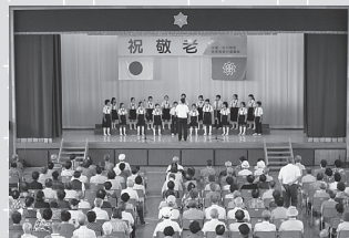
松川小学校 合唱部の皆さん