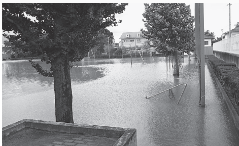
▲冠水の被害を受けた福島第一中学校の校庭

なお、中央地区では中央学習センター、三河台学習センター、市保健福祉センター(※)などに避難所が開設されました。※は福祉避難所