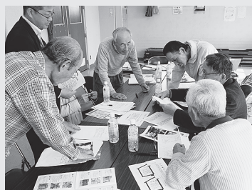
▲熱心に説明内容を検討する歴史愛好会の皆さん

中央西地区まちづくり計画推進懇談会では、地域の皆さんの親睦を深めるとともに、地区の神社や史跡、歴史などを知り、地域への愛着をさらに高めてもらうため「史跡探訪マップと名所案内看板の作成」に取り組んでいます。