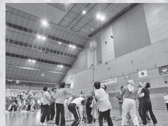
福島市高齢者スポーツ大会 R1.7.4(木) 玉入れ