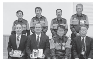
令和元年度贈呈式