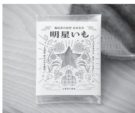
「明星いも」と名付けた干し芋は、りょうぜん漬直売所および福島市役所売店(3階)と小鳥の森整骨院で販売しております。