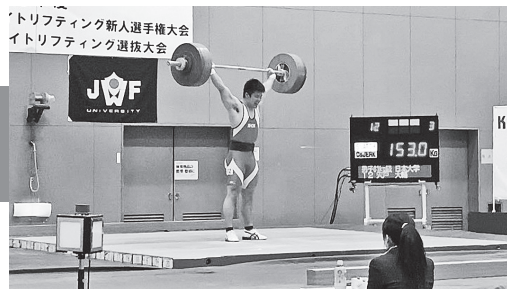
日本新記録となる153kgを成功させた瞬間

2024年のパリ五輪に出場することを目指して頑張っていきますので応援よろしくお願いします！