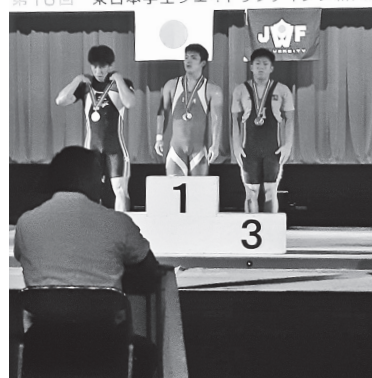
トータル330kgの大会新で優勝

令和 元年 第43回 東日本学生ウエイトリフティング個人選抜大会 第16回 東日本学生ウエイトリフティング新人選抜大会