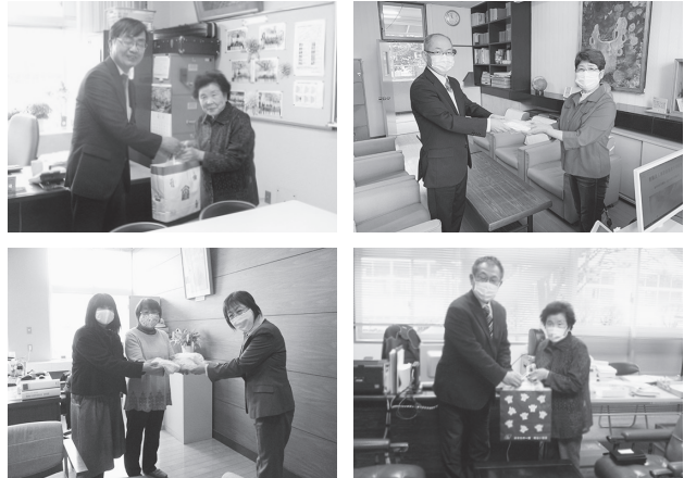
小中学校への寄贈の様子 左上(佐倉小:佐倉婦人会)、右上(荒井小:西女性スクール)、 左下(佐原小:西地区子どもと本をつなぐたんぼぼの会、西棒針サークル)、 右下(西信中:佐倉婦人会)

西地区では、佐倉婦人会、荒井地区婦人会、西棒針サークル、西地区子どもと本をつなぐたんぼぼの会、西女性スクール、主任児童委員、その他地域の皆さまから4月30日時点で合計1,118枚のマスクをご提供いただきました。また、材料(布地やゴムひも)の提供もありました。地域の皆さまの善意に感謝申し上げます。