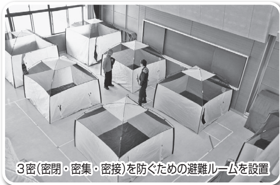
3密(密閉・密集・密接)を防ぐための避難ルームを設置

これから台風シーズンになります。感染症が拡大する中、災害が発生した場合は、一か所の避難所に多くの避難者が避難することは感染リスクを高めることにもつながります。可能な場合は、安全な場所にある親戚や友人の家等への避難や安全性が確保される場合は自宅で垂直避難をすることも考えられます。どのような避難が我が家にとってよいのか考えてみましょう。