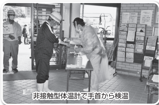
非接触型体温計で手首から検温