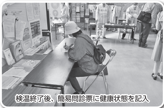
検温終了後、簡易問診票に健康状態を記入