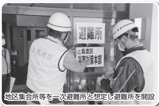
地区集会所等を一次避難所と想定し避難所を開設

今回は、新型コロナウイルス感染症が拡大する中で災害が発生した場合を想定し、集会所等を一次避難所として開設し避難所の分散化を図りました。また避難所では検温や問診を行い避難者の体調を把握し、3密(密閉・密集・密接)を防ぐため避難ルームを設置する等の感染拡大防止対策に特化した内容で実施しました。