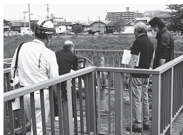
郷野目宝来1号樋門の排水ポンプ設置訓練の様子