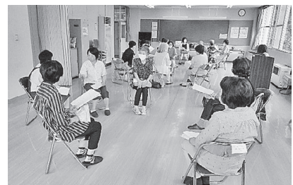
【渡利レディースセミナー】開講式(6/18)後のオリエンテーションの様子

各学級では、「健康」、「防災」、「歴史」、「地域課題」等の学級生が提案したテーマに対し、専門講師からアドバイスを受けながら、活動を進めていきます。