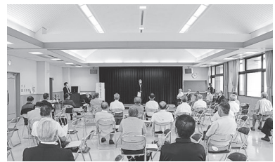
▲長年にわたり、地区の公益と振興に 尽くされた皆さんが受賞されました