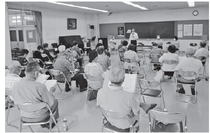
【渡利グレートアカデミー】開講式(7/1)の様子