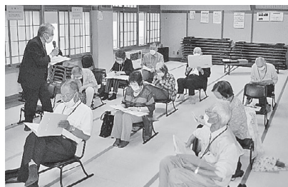
【渡利寿大学】開講式(6/19)での打合せの様子