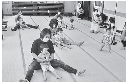
【コアラ学級】開講式(6/8)後のふれあい体操の様子