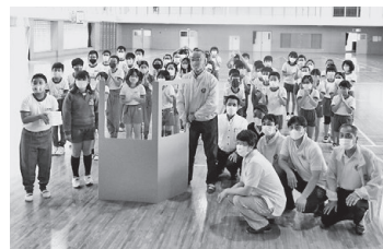
飯野小学校児童と飯野ライオンズクラブ役員の皆さん