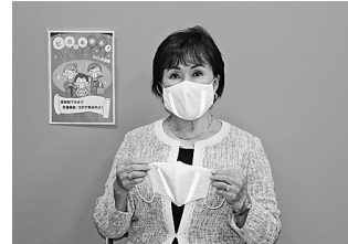
▲コロナ禍でも事故防止のためにできる啓発はないかとの思いで、生活必需品になりつつあるマスクに着目し、反射材を付ければ、誰でも気軽に着用できると考えました

これから 秋の全国交通安全運動に伴う出動式が9月23日(水)に行われ、福島北地区安全運転管理者協会会長をはじめ、福島北警察署員、福島市交通対策協議会鎌田・瀬上・余目方部長、鎌田地区・瀬上・矢野目交通安全母の会会長らが反射材付きマスクを着用しながら完成を披露しました。