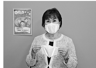
▲コロナ禍でも事故防止のためにできる啓発はないかとの思いで、生活必需品になりつつあるマスクに着目し、反射材を付ければ、誰でも気軽に着用できると考えました

これから 秋の全国交通安全運動に伴う出動式が9月23日(水)に行われ、福島北地区安全運転管理者協会会長をはじめ、福島北警察署員、福島市交通対策協議会鎌田・瀬上・余目方部長、鎌田地区・瀬上・矢野目交通安全母の会会長らが反射材付きマスクを着用しながら完成を披露しました。