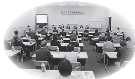
飯坂方部自治振興協議会の様子

八反田川の樹木の伐採や堆積土砂除去の進捗状況については、7月までに東北新幹線下流の約500m区間の伐木を終え、今後は、上流の平野地区から大笹生地区にかけて施工する災害復旧工事と併せて伐木や河道掘削を進めていきます。浸水対策については、井野目堰や既存放水路の管理強化により、県道排水路への負荷軽減を図り、併せて、県道福島飯坂線の側溝改修を県に要望していく。その後の被害状況により、新たな浸水対策について、調査など検討してまいります。