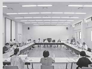
まちづくり懇談会の様子