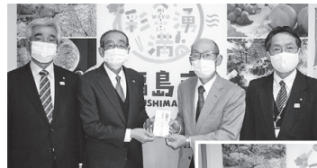
福島松川ライオンズクラブ様