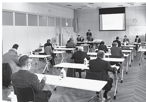
▲10月28日 NCVふくしまアリーナ